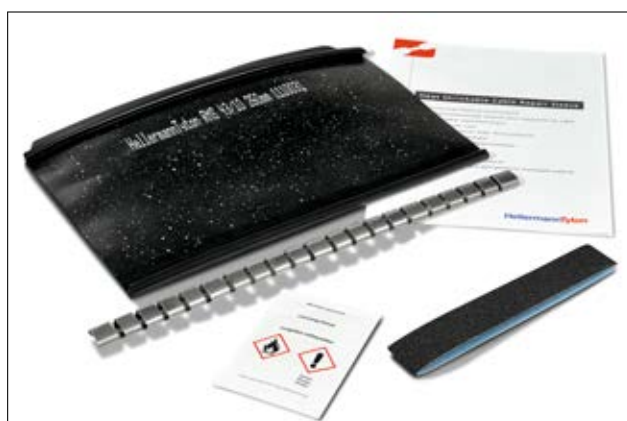
RMS: manicotto di riparazione, cerniera in acciaio, carta abrasiva, kit di pulizia, istruzioni.