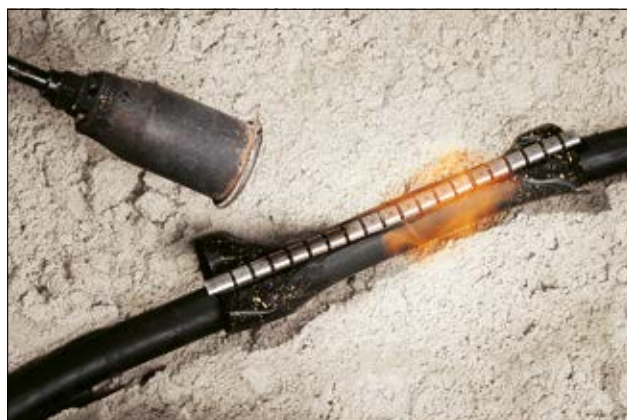
Manicotto avvolgente RMS per una riparazione veloce ed affidabile del cavo.